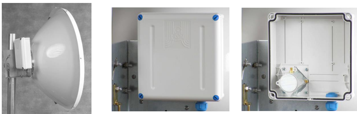
Obr. 2 Použití s GentleBOXem