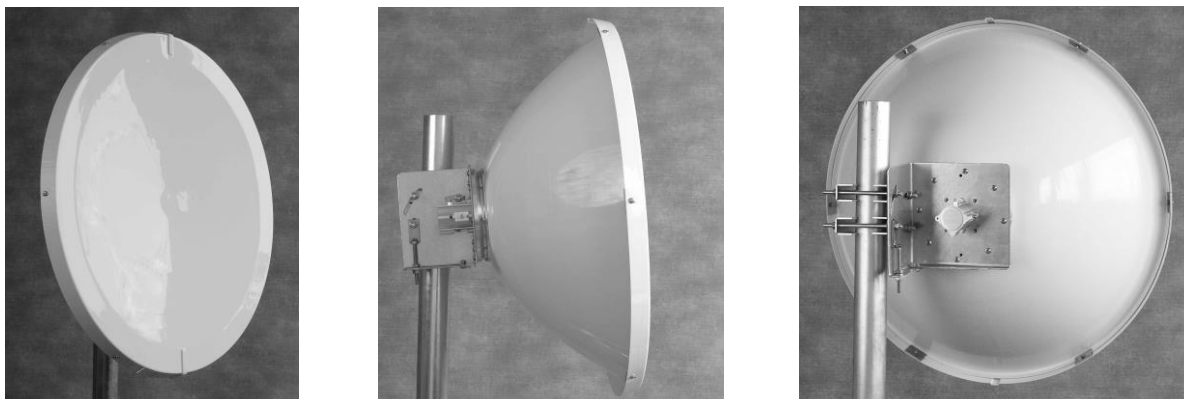
Obr. 1 Základní provedení antény